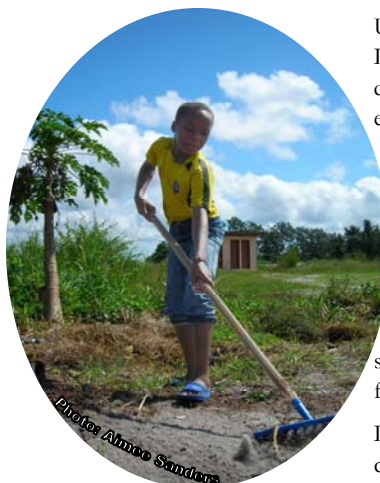
Un élève nettoie son école.

Une ligne a été tirée dans le sable. Les étudiants à l'École Publique C de Mayumba ont pris des râteaux et des sacs poubelles, et puis le nettoyage a commencé. Chaque classe a réhabilité une section prédéterminée de la cour de l'école, en enlevant le verre cassé, les coquilles d'huîtres, et les sachets en plastique qui peuvent poser un danger non seulement aux humains, mais à la faune aussi.