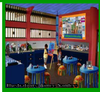
Illustrations: Almee Sanders