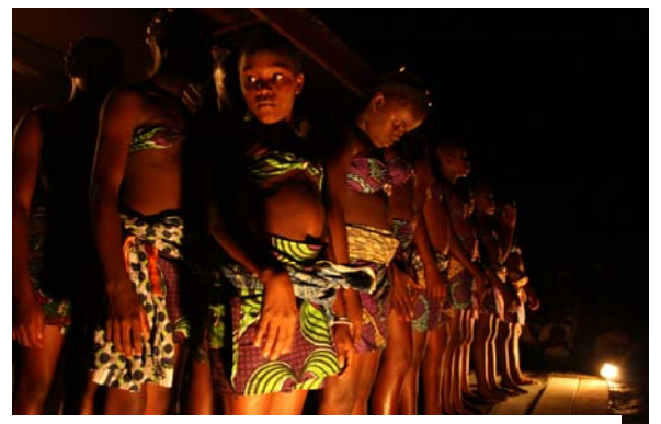
La troupe de danse Ndosy anime le festival.